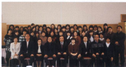
アプロ株式会社 新年会 2012